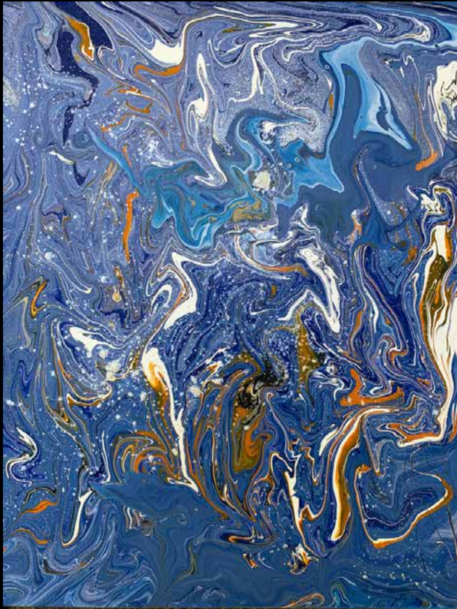
ZANNIE ACRILICO SOBRE MADERA 40 CM. x 40 CM.