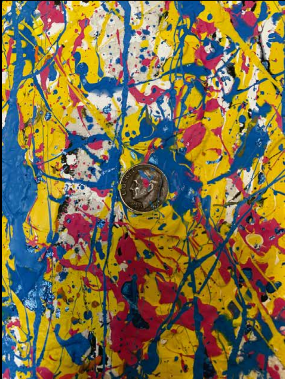
PENNY ACRILICO SOBRE TELA 60 CM. x 60 CM.