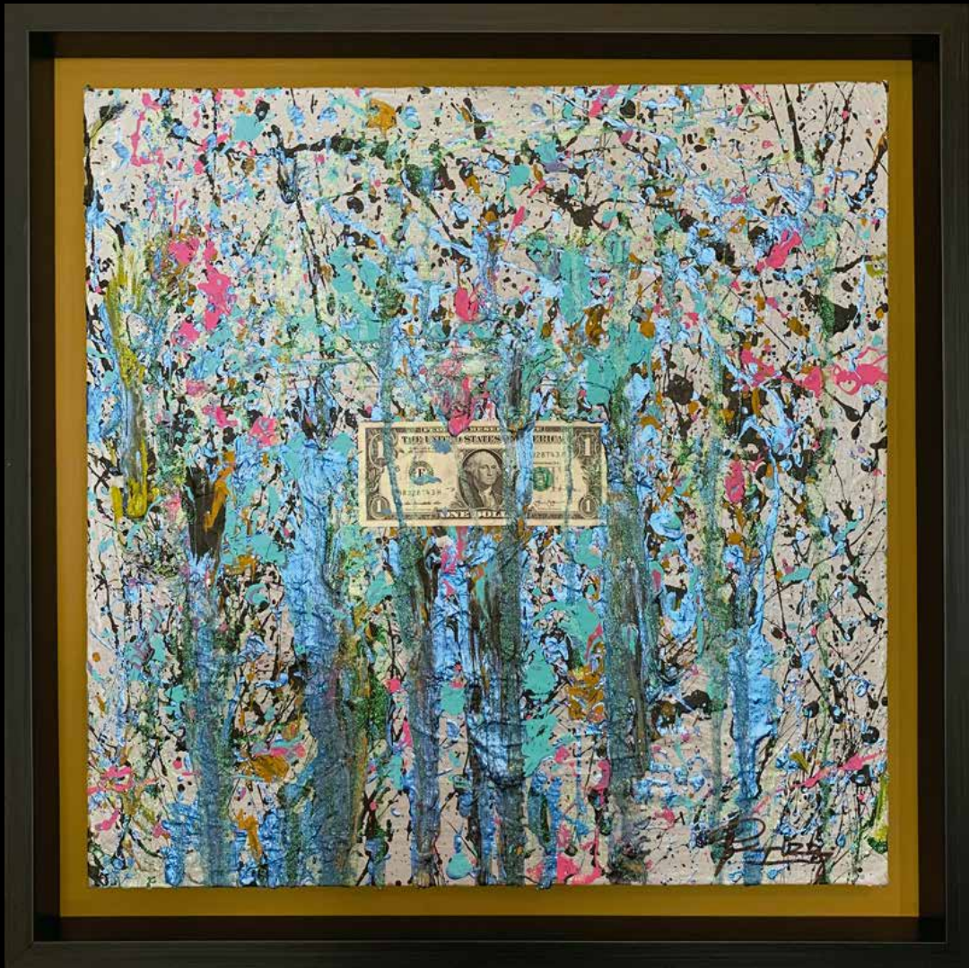
E11EVEN2 ACRILICO SOBRE TELA 60 CM. x 60 CM.