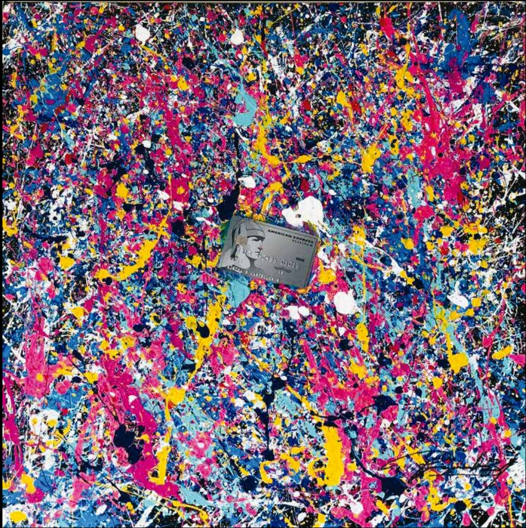
UINI ACRILICO SOBRE TELA 60 CM. x 60 CM.