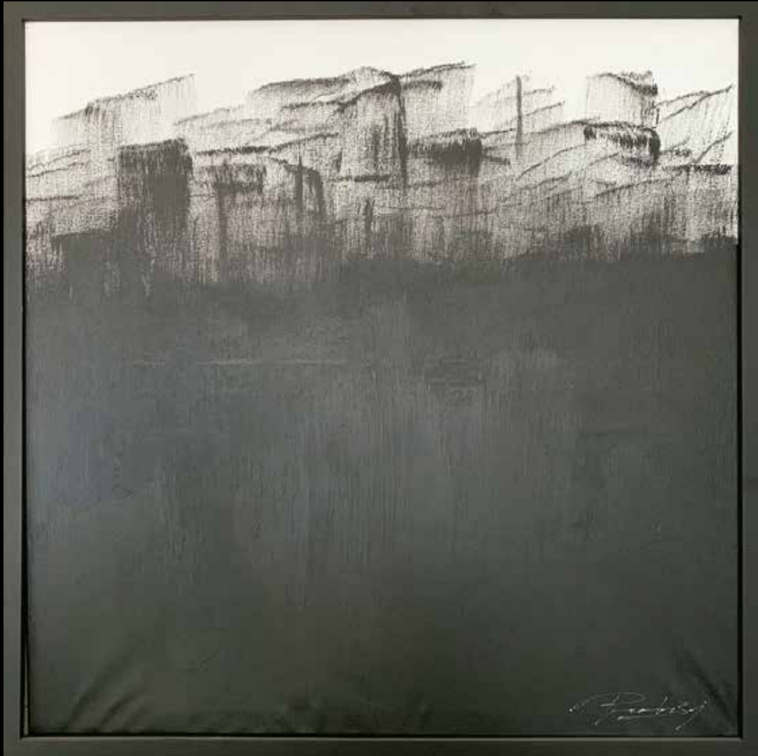
MODERN BLACK CITIES ACRILICO SOBRE TELA 90 CM. x 90 CM.