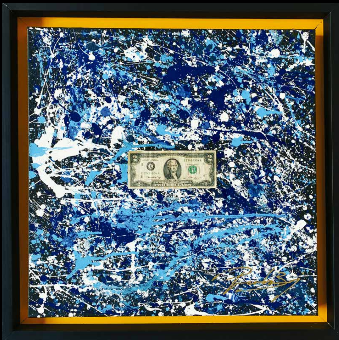
LUCKY PEE ACRILICO SOBRE TELA 60 CM. x 60 CM.