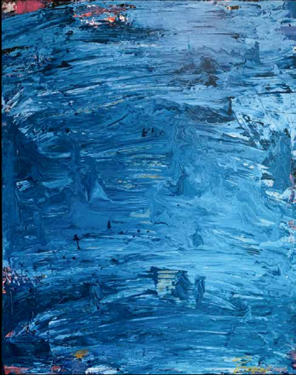
BLEU ACRILICO SOBRE TELA 90 CM. x 60 CM.