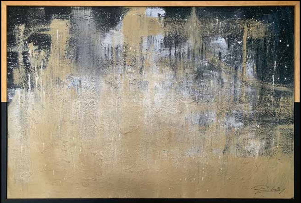
TROIS ACRILICO SOBRE TELA 120 CM. x 80 CM.