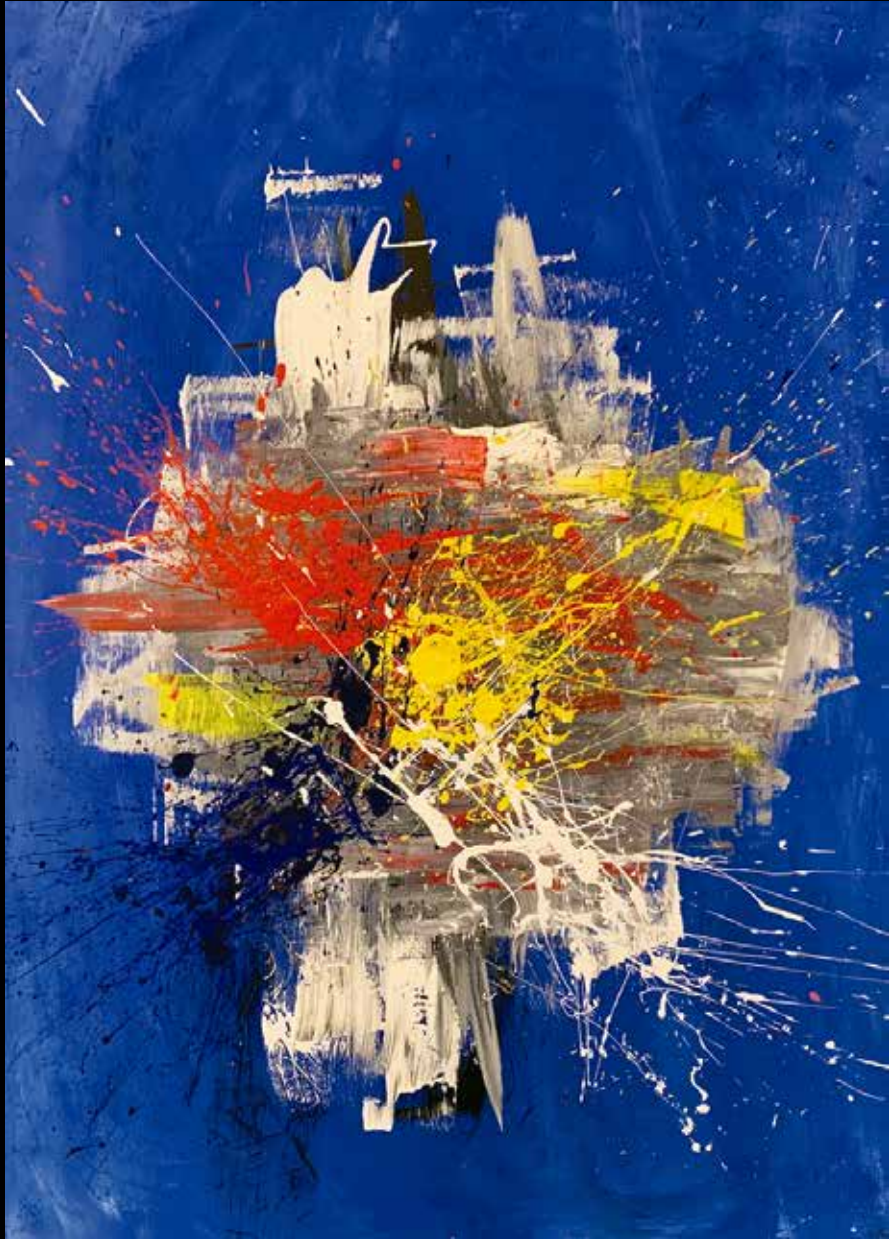
PENNY ACRILICO SOBRE TELA 90 CM. x 60 CM.