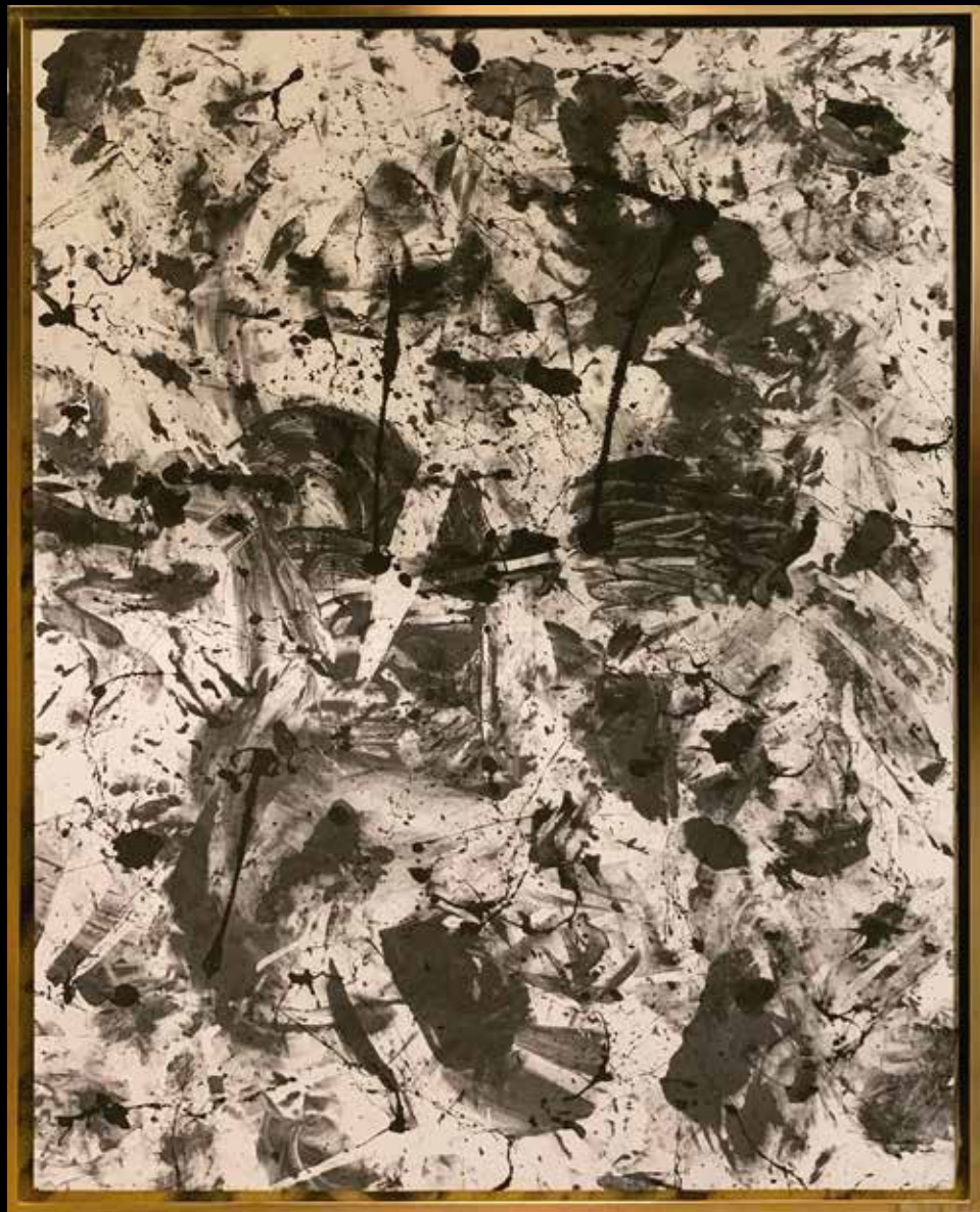
GOLDEN HOUR ACRILICO SOBRE TELA 120 CM. x 80 CM.