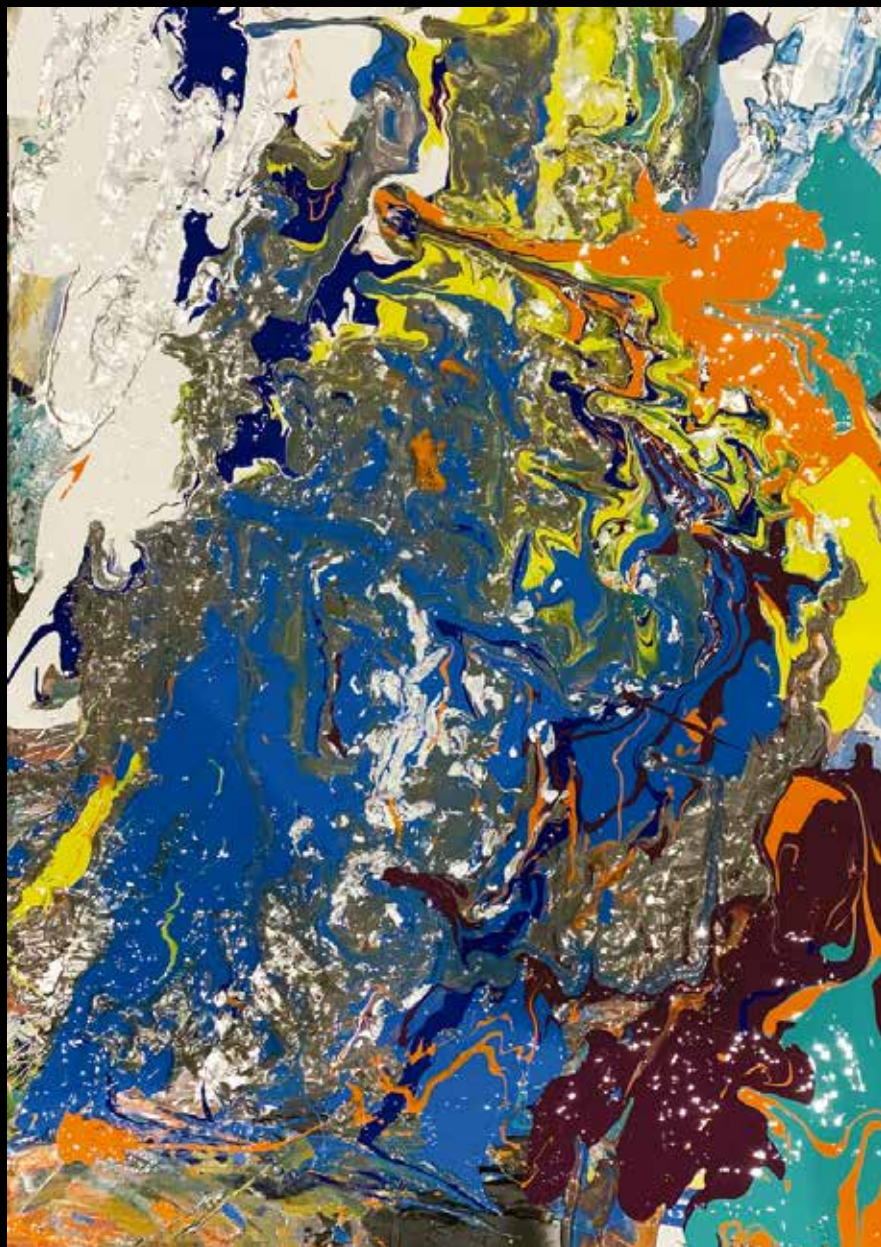
JESS ACRILICO SOBRE TELA 90 CM. x 60 CM.