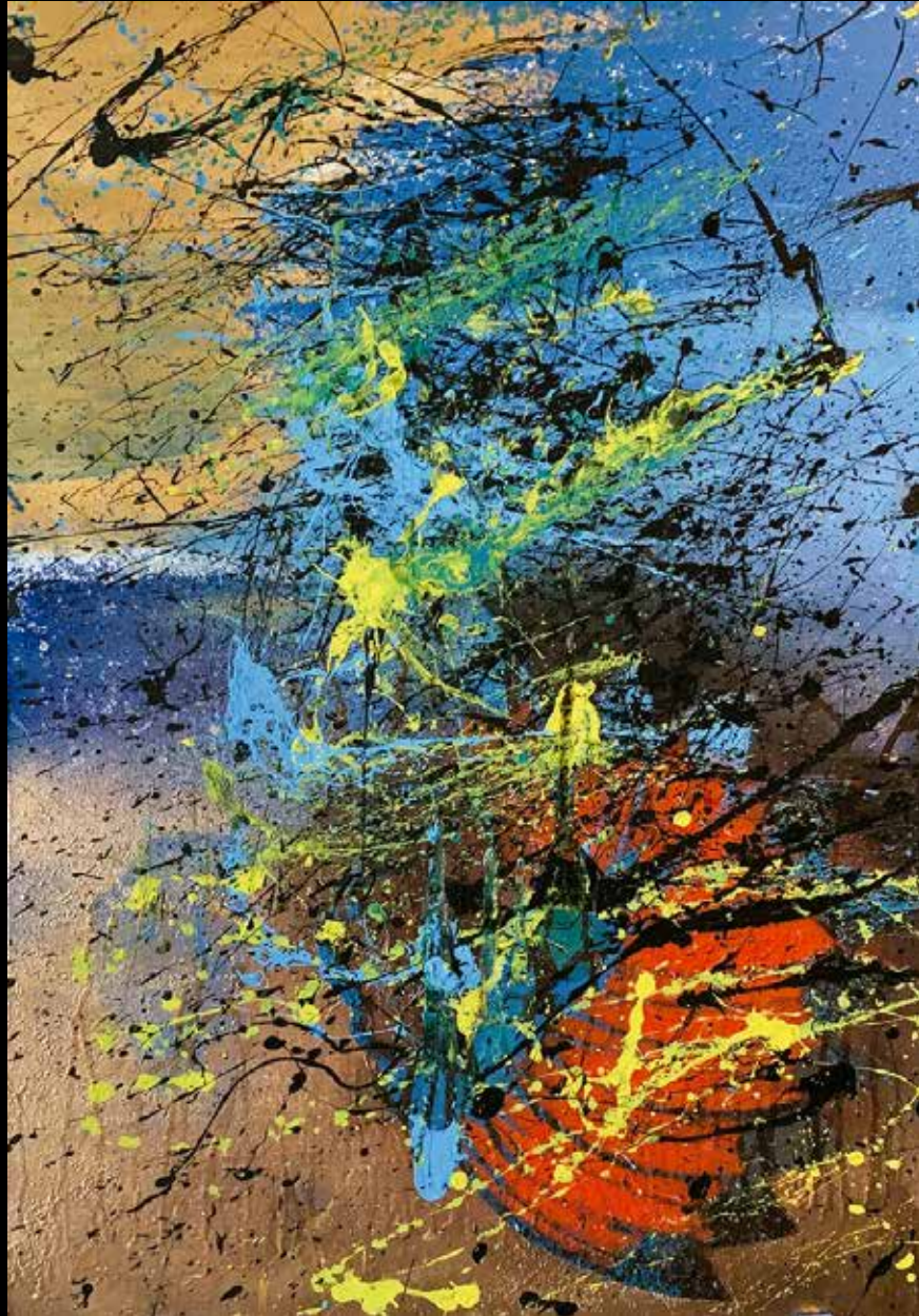
RLDNT ACRILICO Y AEROSOL SOBRE TELA 90 CM. x 60 CM.